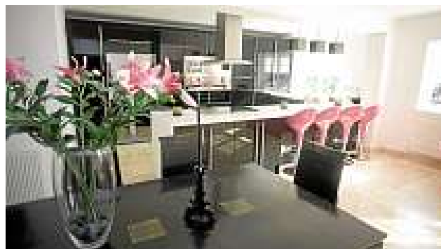
Savoir mettre en valeur son intérieur pour vendre plus vite.

"On n'est pas là pour tricher ou masquer," souligne Mickaël Nabet d' "Embelliss' immo". Il s'agit surtout de mettre en valeur vos biens, meubles comme locaux, en respectant les trois commandements du "home stager" : éclairer un maximum, éviter